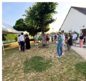
soirée partenaires pendant le tournoi